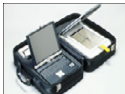
• Analizador de Calidad de Arroz RN300