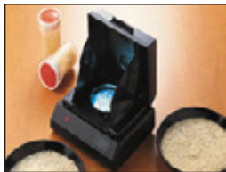
• Analizador de Arroz TX200

Kett se mantiene detrás de los sistemas TR250 con una Garantía de fabricación de un Año completo en Cuidados de piezas , mano de obra y cumplimiento de las especificaciones. La solvencia y confiabilidad Kett le permite enfocarse productivamente en el mejoramiento de la calidad de sus productos sin perder tiempo calibrando y verificando nuestras mediciones. Kett es reconocida a nivel mundial como el líder mundial en instrumentos de medición de granos. Con más de 65 años de diseños y fabricación de excelencia, el TR250, como todos los instrumentos Kett, es el estándar en el cual los otros son juzgados.