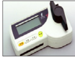
• Medidor de Humedad Portátil Riceter