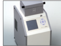
• Analizador Instantáneo de Composición de Arroz AN820