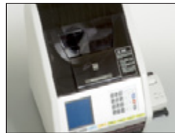
• Clasificadora de Arroz Automatizado RN600