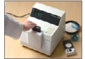
• Medidor de Blancura de Arroz C600