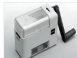
• Descascaradora de Arroz Portátil TR130