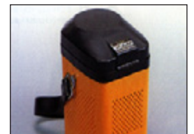
• Pulidora de arroz Pearlest